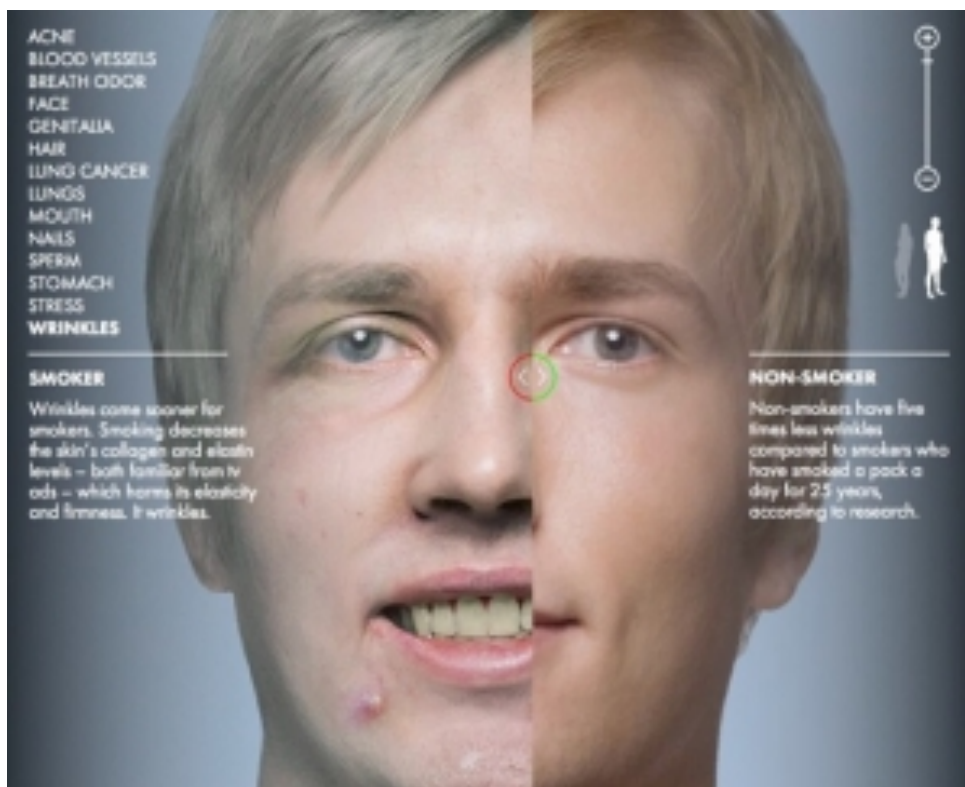
Comparaison d'un visage de fumeur avec celui d'un non-fumeur.

Alors prenons l'exemple de l'homme et intéressons-nous au visage